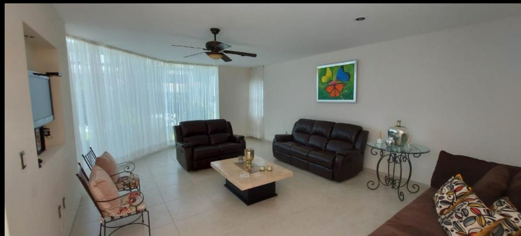
SALA DE TELEVISION