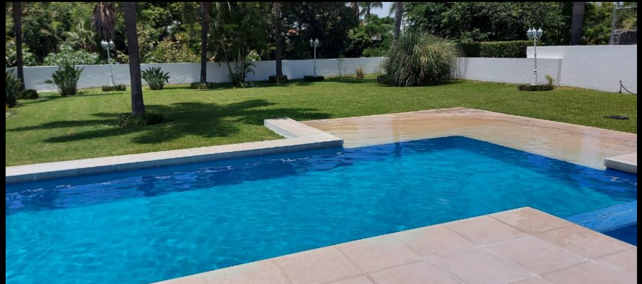
ALBERCA CON JACUZI