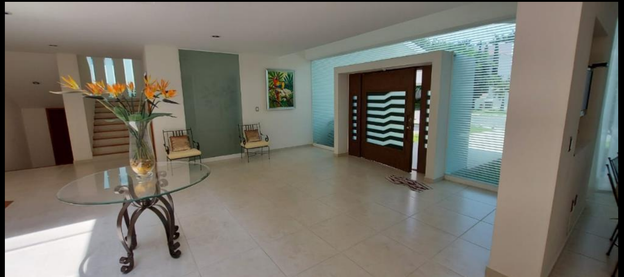
VESTIBULO PLANTA BAJA