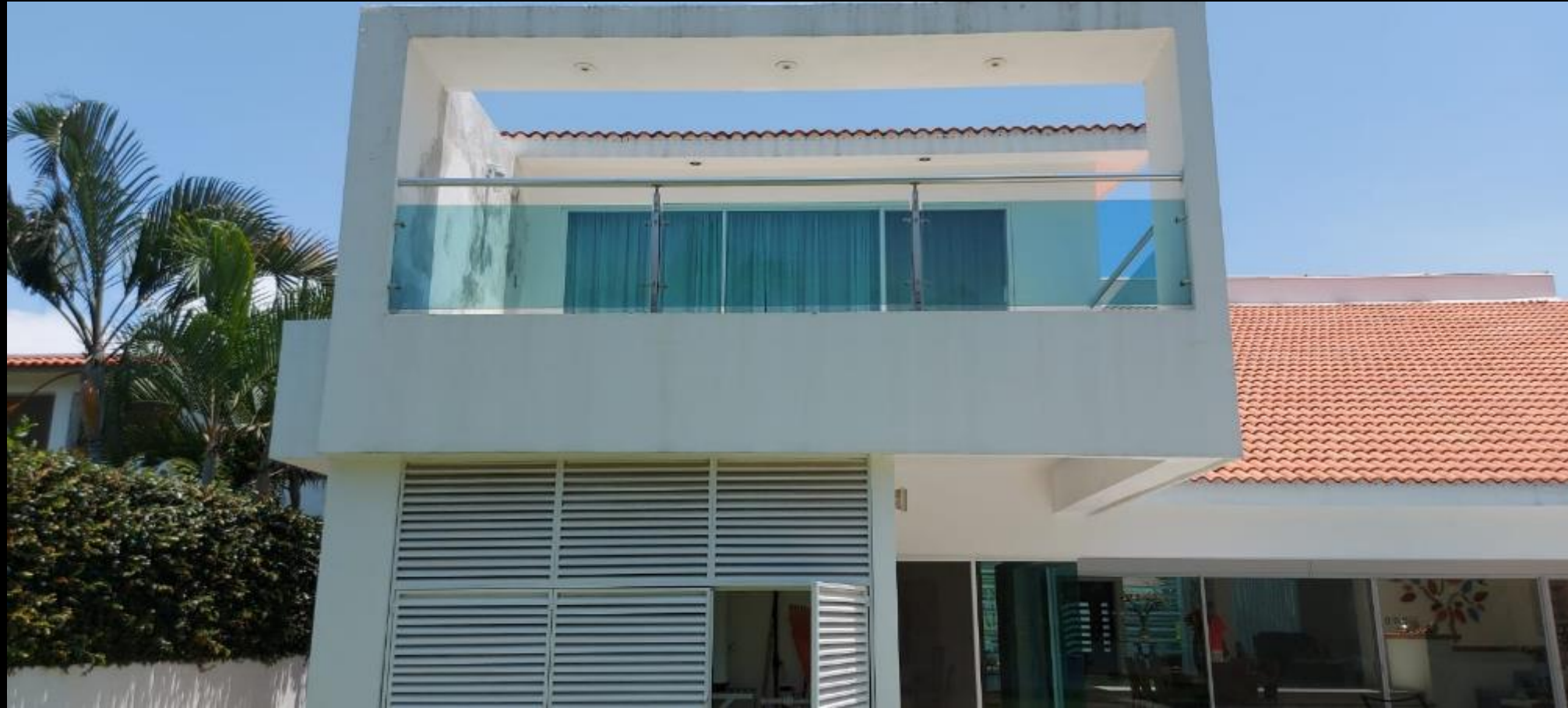
TERRAZA RECAMARA PRINCIPAL