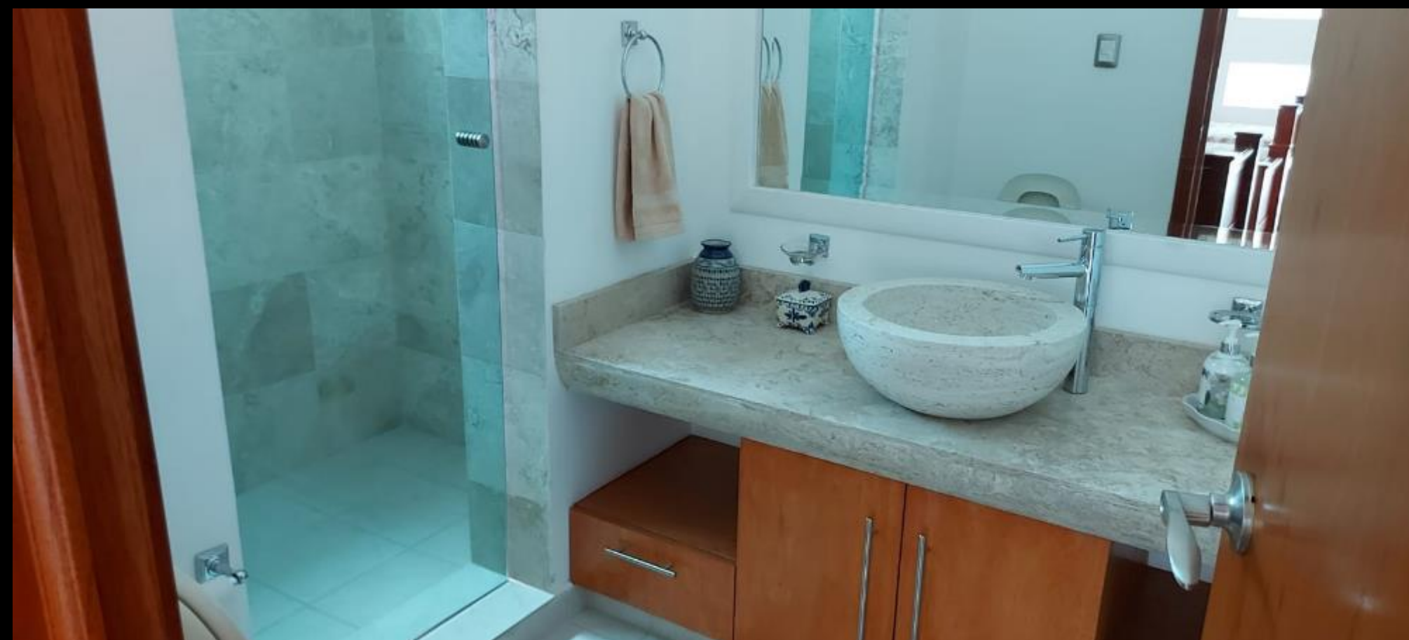
BAÑO RECAMARA DOS