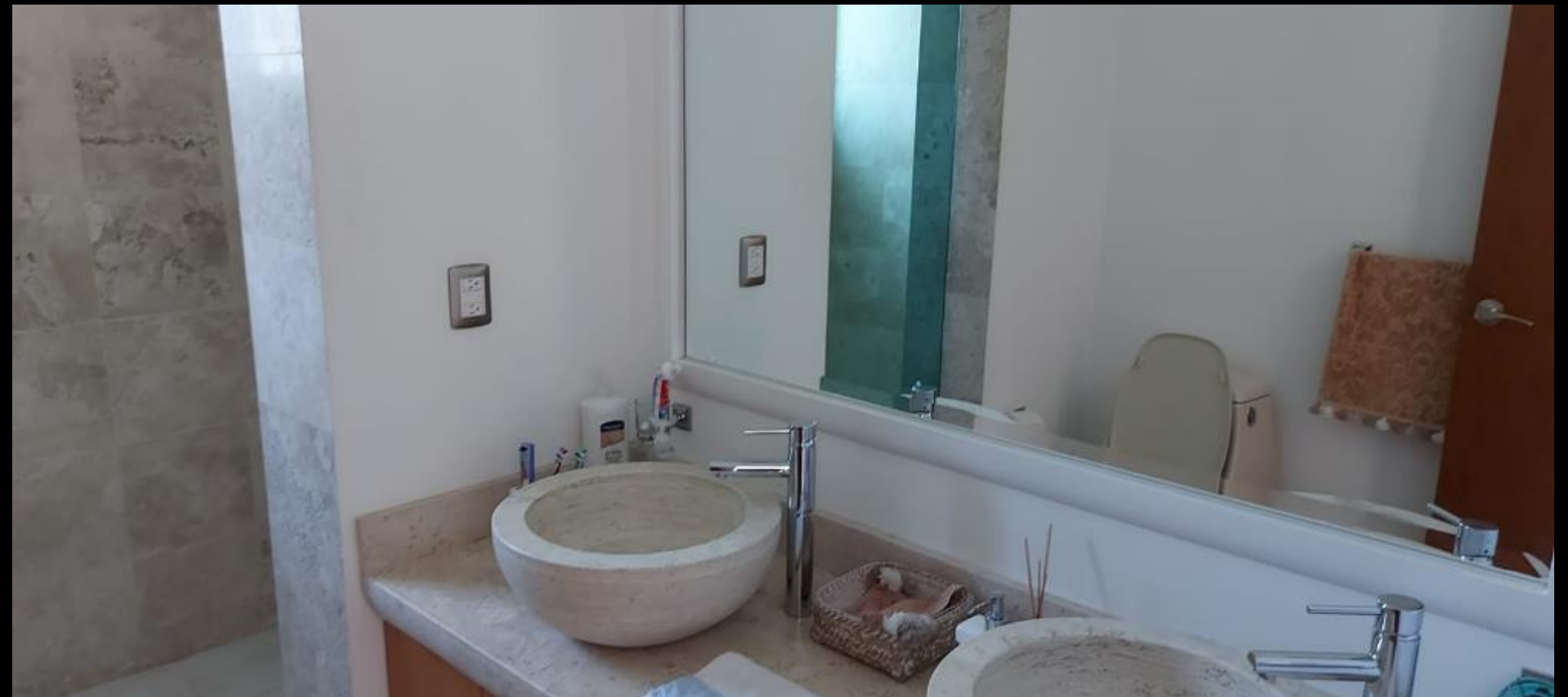
BAÑO RECAMARA PRINCIPAL