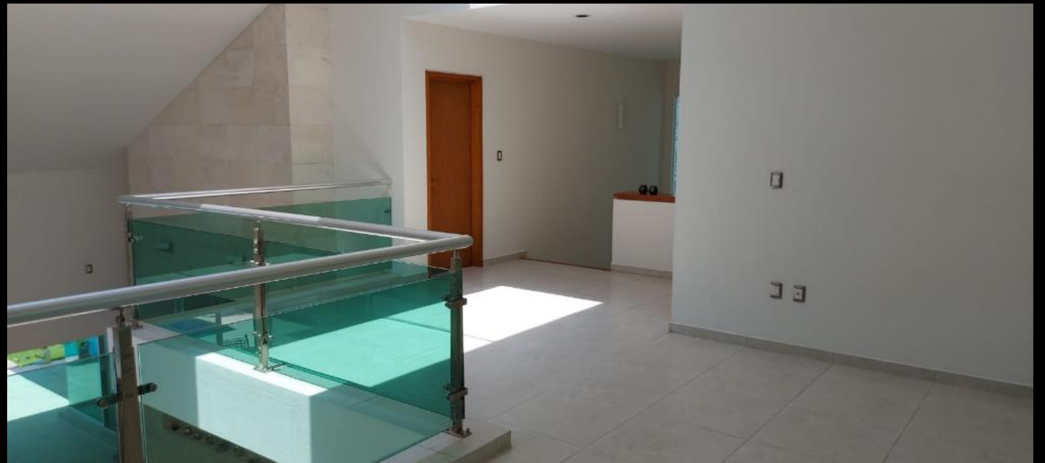
VESTIBULO PLANTA ALTA