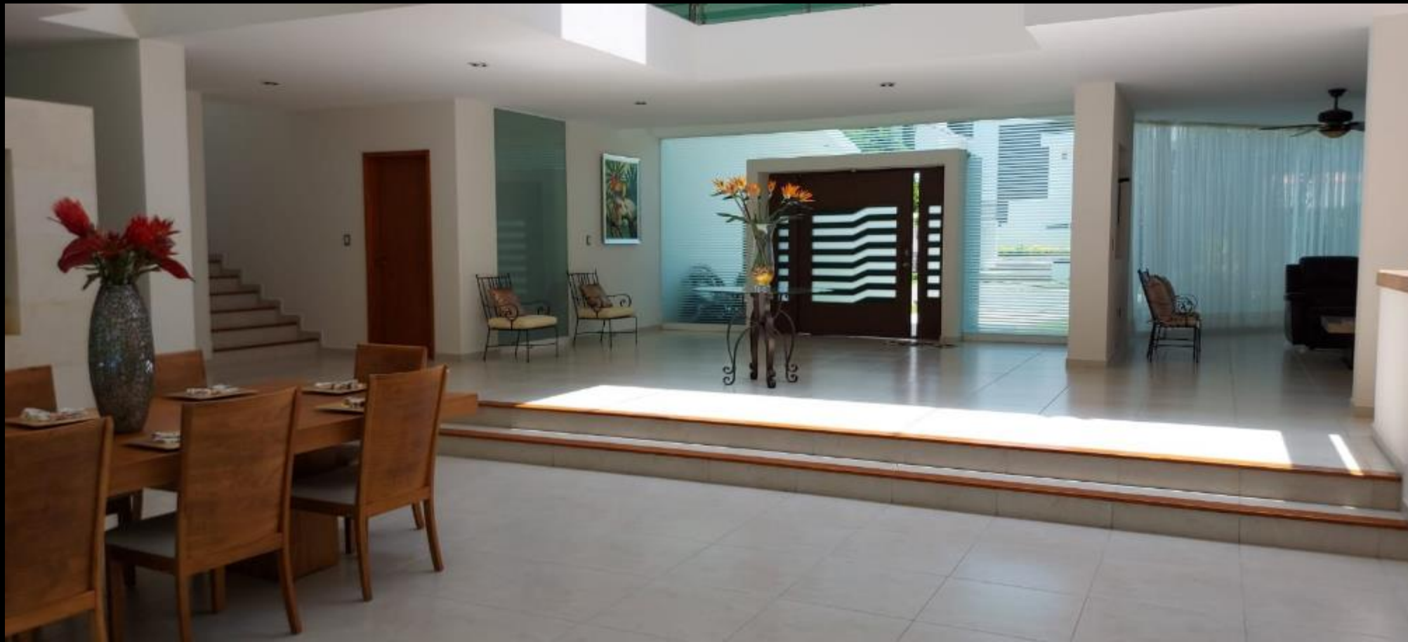
VESTIBULO PLANTA BAJA