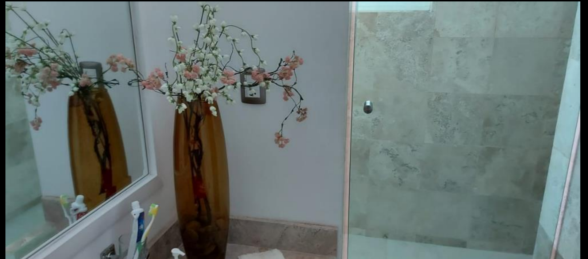
BAÑO RECAMARA TRES