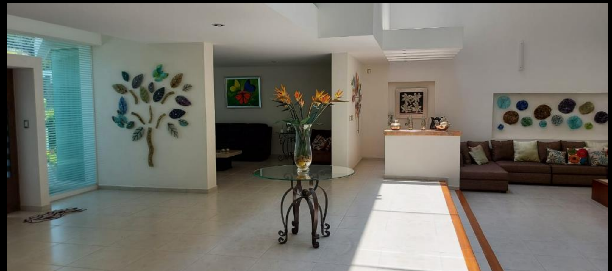
VESTIBULO PLANTA BAJA