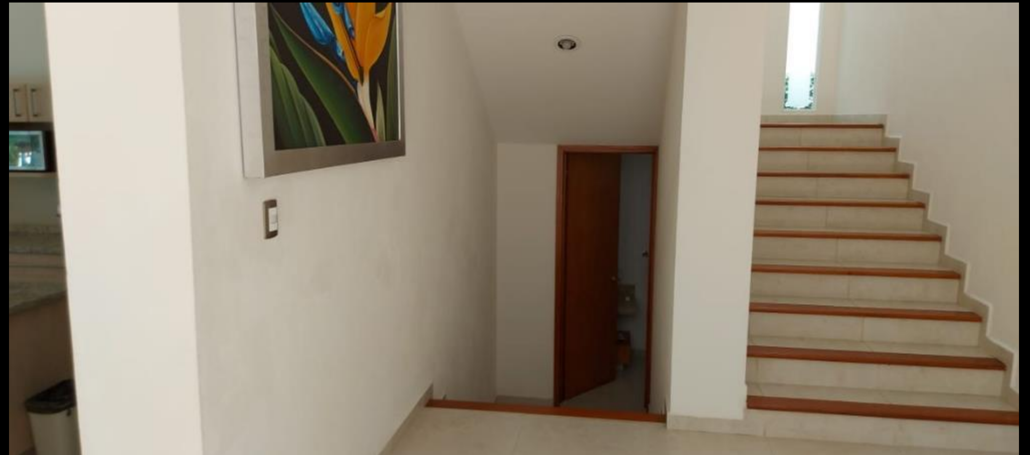
MEDIO BAÑO PLANTA BAJA