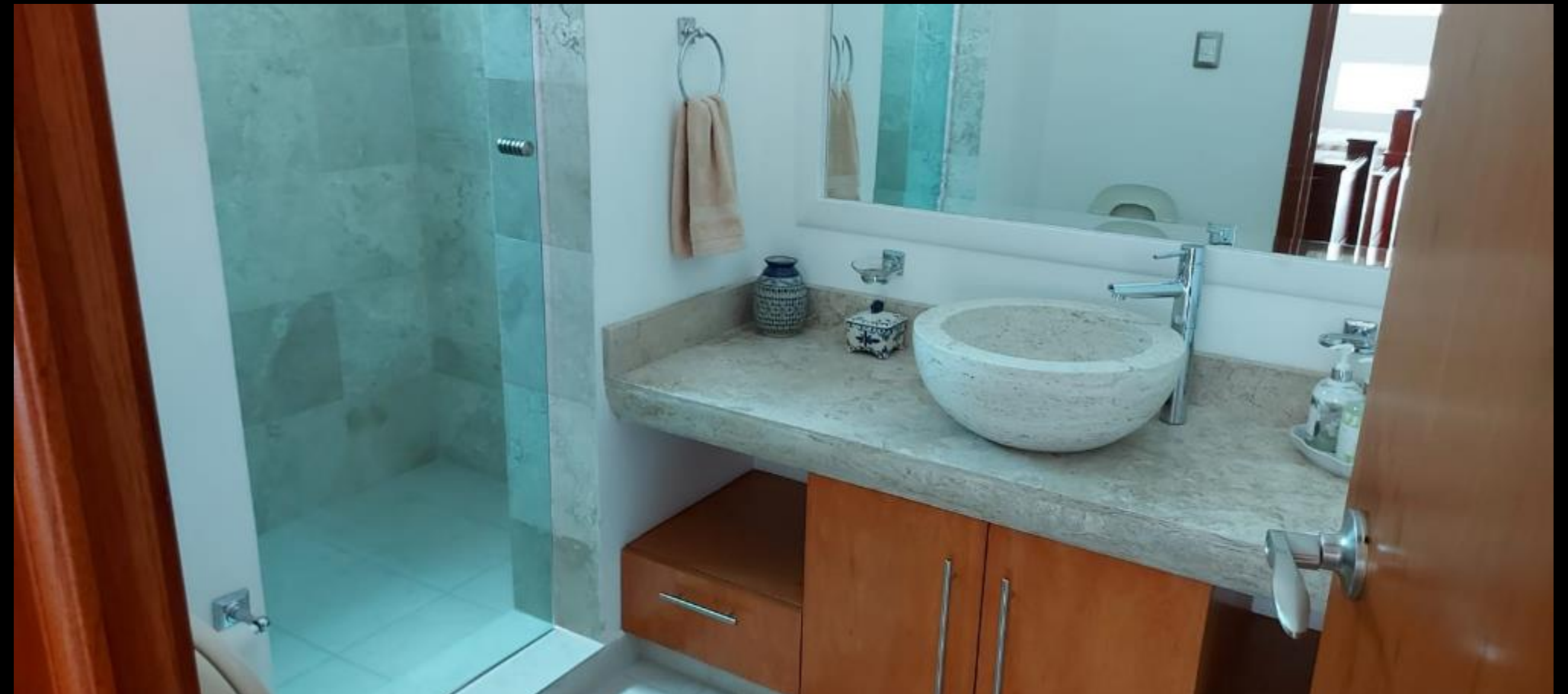
BAÑO RECAMARA CUATRO