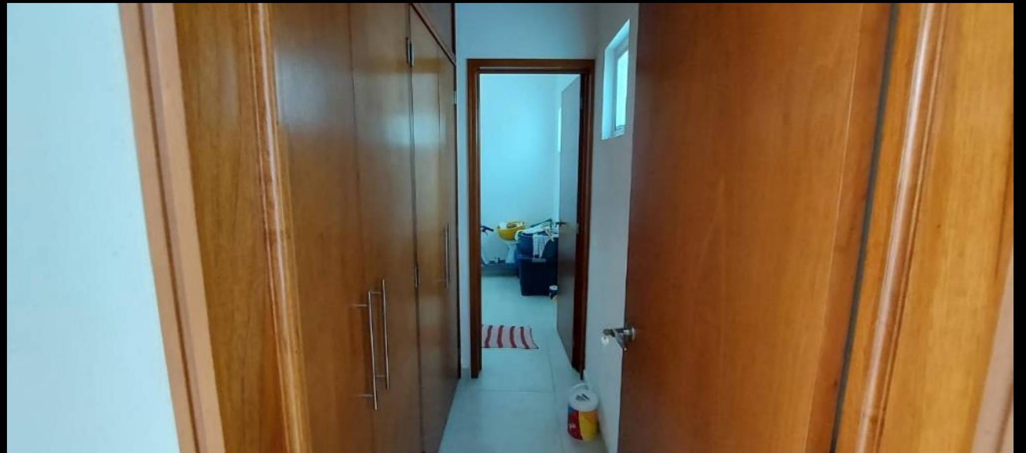
CLOSET CUARTO DE SERVICIO