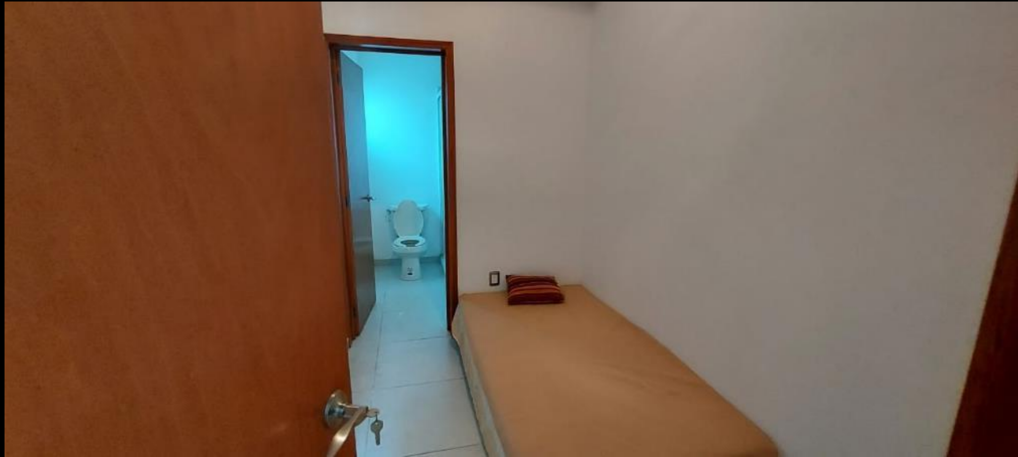
RECAMARA CUARTO DE SERVICIO