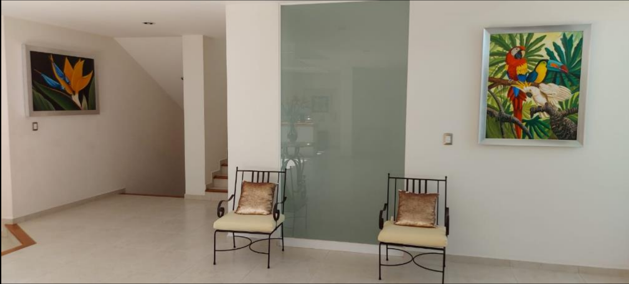
VESTIBULO PLANTA BAJA